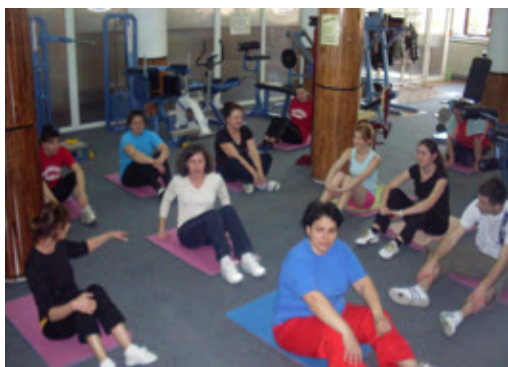
Fig. 13 – Antrenament de fitness muscular.