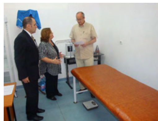
Fig. 5 – Prezentarea domnului Rector a cabinetului de kinantropometrie.