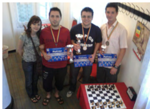
Fig. 15 – Spațiu alocat jocului de șah.