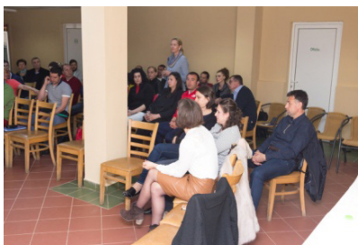
Aspects during the workshop proceedings.