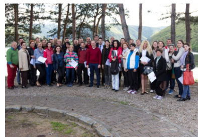
Group picture at the end of the workshop proceedings.