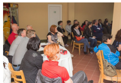
Teachers participating in the workshop proceedings.