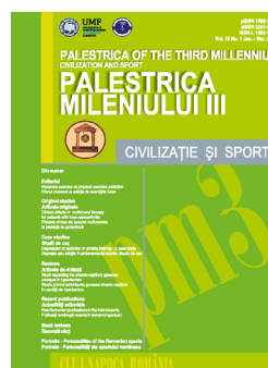
Coperta și formatul actual, 2014