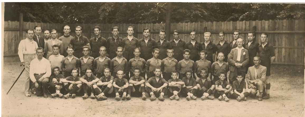
Fig. 7 – Stăruința Oradea, echipele de seniori, juniori și copii împreună cu antrenorii și conducătorii lor.

2. Stăruința Oradea a apărut ca o alternativă a