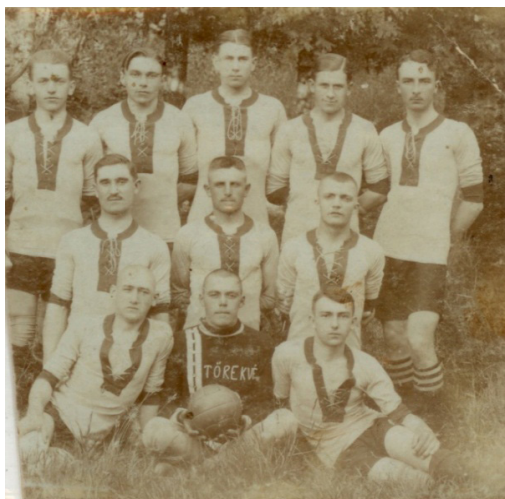
Fig. 3 – 1912. Componentii ai echipei de fotbal Stăruința Oradea.