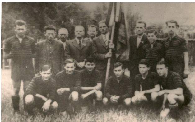
Fig. 6 – Conducători și jucători ai Stăruința Oradea purtând steagul grupării (Albumul Ujhelyi Oszlár).